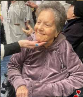
Un San Valentino speciale per gli ospiti della Pelucca