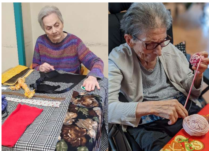
Attività, giochi e creatività nelle strutture della Fondazione