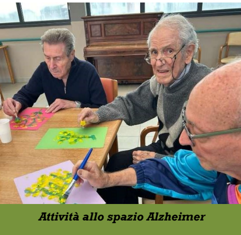
Attività allo spazio Alzheimer