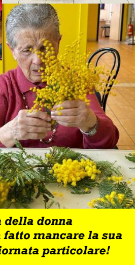
8 Marzo - Festa della donna Anche il sindaco non ha fatto mancare la sua vicinanza in questa giornata particolare!