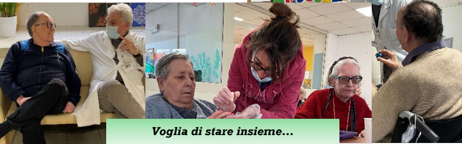
Voglia di stare insieme...