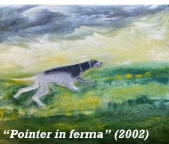
"Pointer in ferma" (2002)