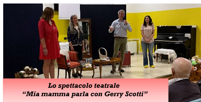
Lo spettacolo teatrale "Mia mamma parla con Gerry Scotti"