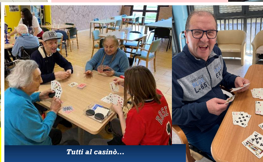
Tutti al casinò...