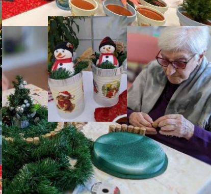
È tornato il tradizionale mercatino il "Pelucchino" allestito dagli ospiti della Fondazione di entrambe le sedi