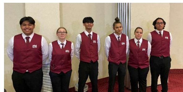
I ragazzi di AFOL che hanno preparato la cena di Natale per la Fondazione e i suoi ospiti