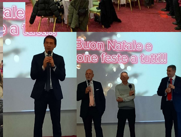
Buon Natale e buone feste a tutti!!