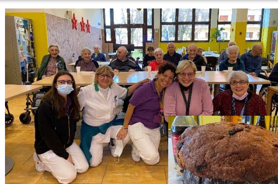
Brindisi di Capodanno e panettone per festeggiare l'arrivo del 2024!