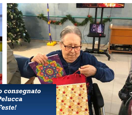
I volontari della Fondazione Amplifon hanno consegnato i doni di Natale a tutti gli ospiti della Pelucca festeggiando insieme l'arrivo delle Feste!