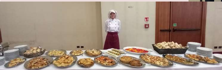
buone feste a tutti