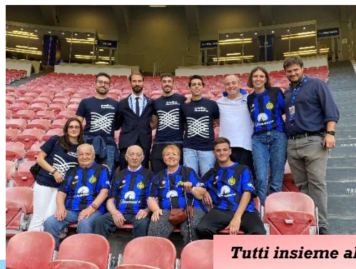
Tutti insieme allo stadio...