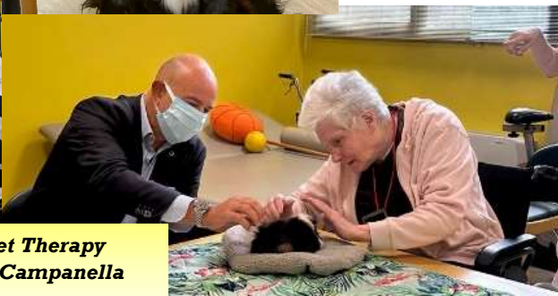
Al via la nuova attività di Pet Therapy che si tiene nella sede di via Campanella