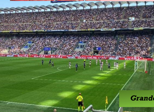
Grande emozione all'arrivo al Meazza!