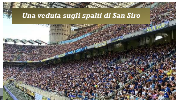
Una veduta sugli spalti di San Siro