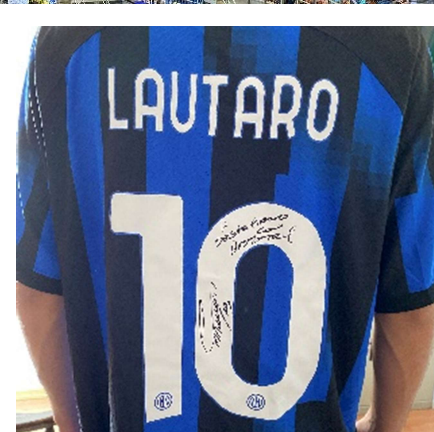
La maglia autografata donata dal capitano dell'Inter Lautaro Javier Martínez