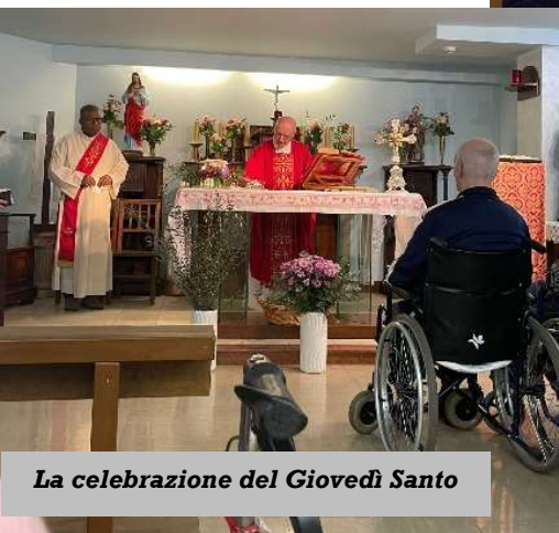
La celebrazione del Giovedì Santo