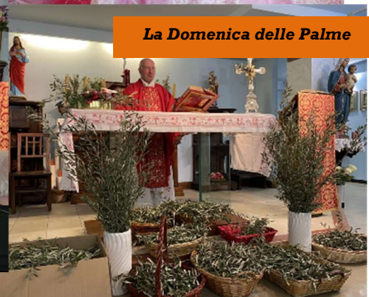
La Domenica delle Palme