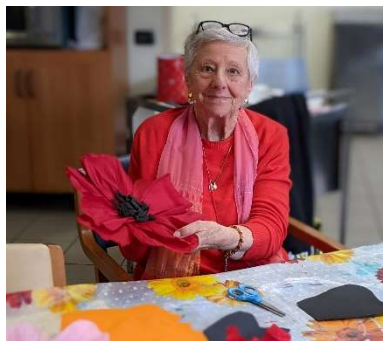
Tutti i giorni gli ospiti partecipano a nuovi laboratori creativi che si tengono nelle sedi di via Campanella e via Boccaccio