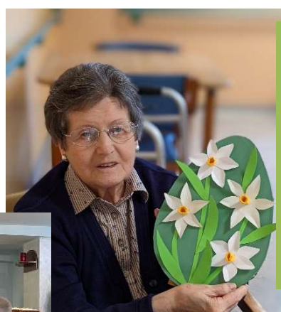
Sono state molte le attività che durante le festività Pasquali hanno coinvolto gli ospiti in entrambe le sedi della Pelucca