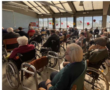
Grande partecipazione alla Festa di Primavera che si è svolta in Fondazione