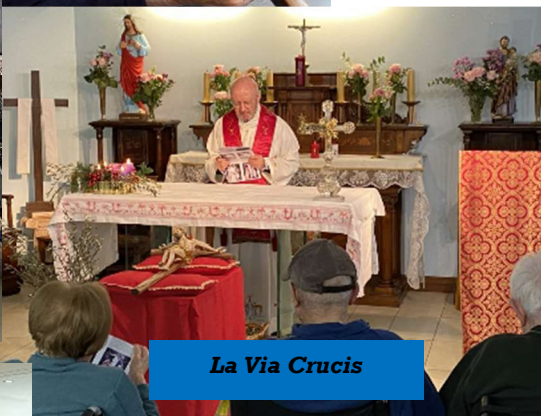
La Via Crucis