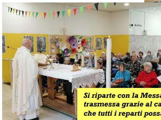
Si riparte con la Messa la domenica mattina che viene trasmessa grazie al canale tv interno della Fondazione così che tutti i reparti possano seguire l'evento