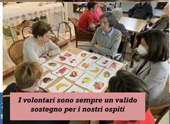
I volontari sono sempre un valido sostegno per i nostri ospiti