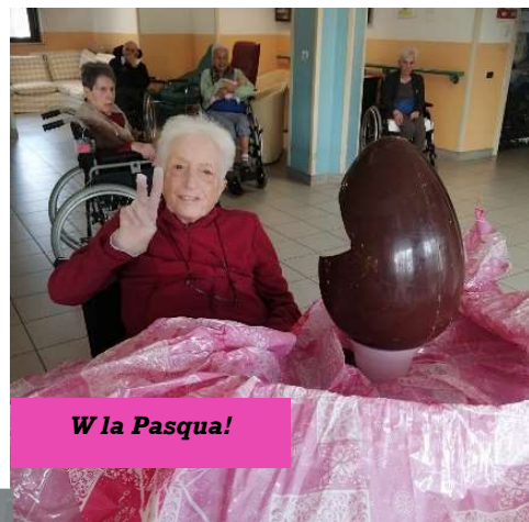
W la Pasqua!