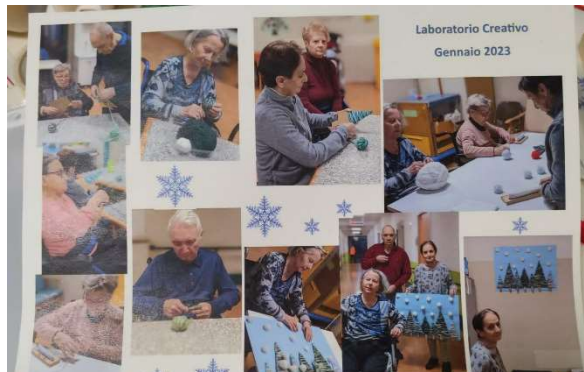
Laboratorio Creativo Gennaio 2023