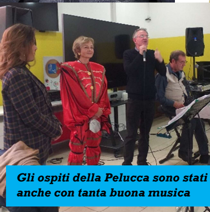
Gli ospiti della Pelucca sono stati intrattenuti anche con tanta buona musica