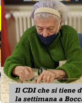
Il CDI che si tiene durante la settimana a Boccaccio