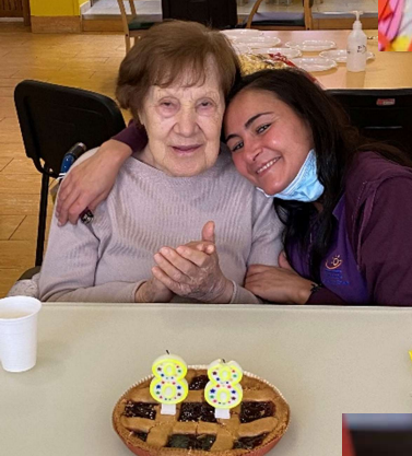
Musica, compleanni e tanto intrattenimento