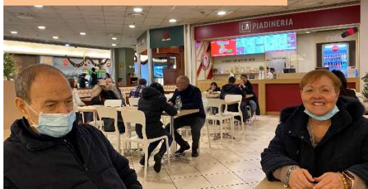
In giro per la città insieme agli operatori della Fondazione