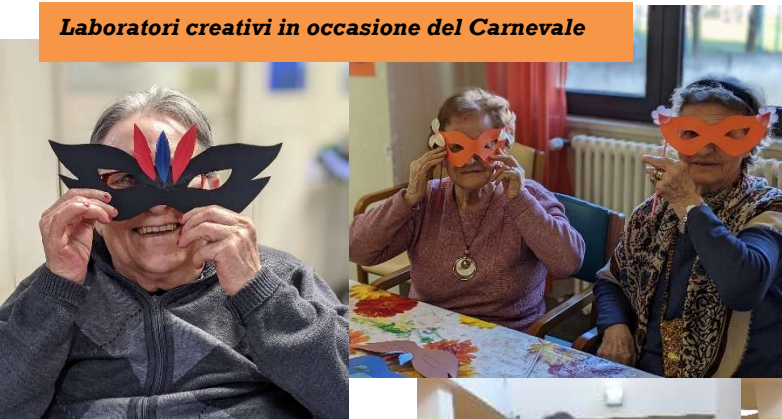
Laboratori creativi in occasione del Carnevale