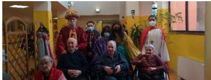
Grande partecipazione durante la festa di Carnevale dove volontari AVO e parenti sono intervenuti numerosi