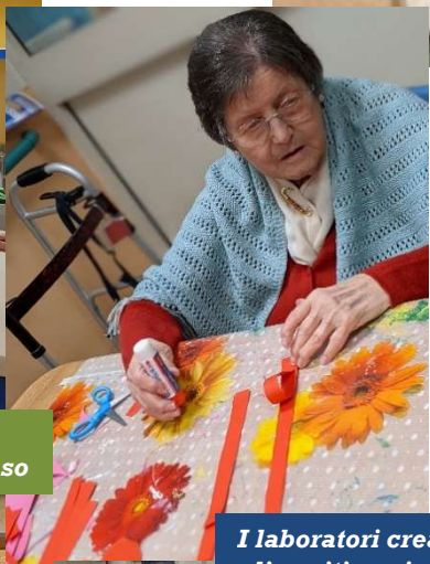
I laboratori creativi impegnano gli ospiti ogni giorno nelle sedi della Fondazione