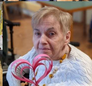
Anche a San Valentino non sono mancati i festeggiamenti...