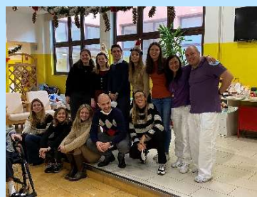
Durante le Feste natalizie i dipendenti Amplifon hanno portato i regali agli ospiti di via Campanella e via Boccaccio regalando così un sorriso a tutti!