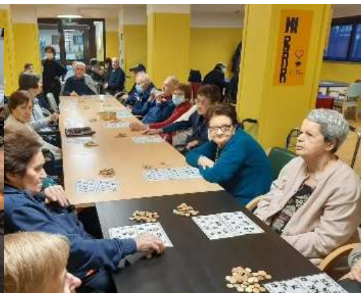
Durante la Festa di Natale del 22 dicembre, anche i nostri operatori sanitari e i volontari si sono attivati coinvolgendo gli ospiti della Fondazione mettendo in scena concerti di musica e canti oltre a giochi e intrattenimento