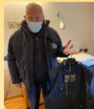
Angelo con il regalo ricevuto dai "Nipoti di Babbo Natale"

Cernobbio. L'iniziativa i Nipoti di Babbo Natale è nata dall'esigenza di voler essere più vicino ai nostri anziani e regalare loro un sorriso facendoli sentire meno soli. Una testimonianza del fatto che qualcuno ha pensato a loro dedicandogli del tempo e facendoli sentire più importanti e parte di un progetto di vita ma non solo, ogni "nipote" ha potuto così vivere e sperimentare la gioia di donare ritrovando così il vero senso del Natale.