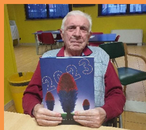
Un ospite mostra con orgoglio il nuovo calendario dell'Arma dei Carabinieri

Le nostre Forze dell'Ordine sempre in prima linea anche attraverso la solidarietà