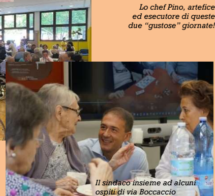
Il sindaco insieme ad alcuni ospiti di via Boccaccio