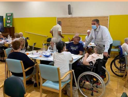
Il direttore della Fondazione Marco Ballarini insieme ad alcuni ospiti e parenti della sede di via Campanella