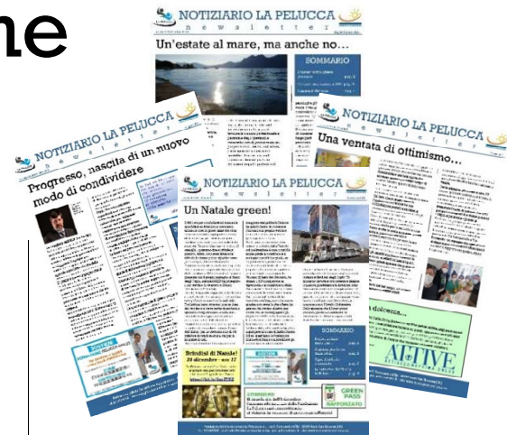
Il notiziario della Pelucca è uno dei nuovi strumenti messi in campo dalla Fondazione per essere sempre aggiornati sulle novità

Durante il periodo pandemico, la Fondazione ha messo in campo tutto il suo impegno cercando così di reagire nel migliore dei modi a questa fase caratterizzata da forti restrizioni e introducendo una serie di nuove iniziative che hanno avuto il preciso scopo di favorire il lavoro, la comunicazione e le informazioni: la nascita del notiziario della Pelucca - che viene pubblicato mensilmente - informa su novità, attività e notizie inerenti tutto quello che accade all'interno delle sedi della Fondazione.