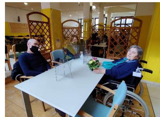
Gli incontri in presenza attraverso il plexiglass hanno permesso di riprendere le visite in struttura

Sono stati poi potenziati gli strumenti tecnologici che sono serviti a rendere più fruibile la relazione tra Ospiti e familiari con le videochiamate, le attività da remoto e le riunioni organizzate tramite zoom per non perdere il contatto tra operatori e familiari; i bollettini emessi periodicamente che aggiornavano sulla situazione clinica degli anziani per informare le famiglie che non potevano avere accesso alle strutture; è stato rinnovato anche tutto l'impianto telefonico in tutti i reparti ma non solo; sono state introdotte le nuove figure dei navigator che hanno avuto il